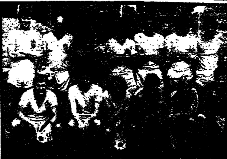
المنتخب الوطني السويدي يابل مفاجأة منتخب اسراييل والقوز عليه .. هكذا يابل مدرب المنتخب

قرر الاتحاد العام لكرة القدم الاسرائيلي في جلسة خاصة منح كل لاعب من لاعبي منتخب الوطني الاسرائيلي مبلغ ٣٠ ألف ليرة في حالة فوز اسراييل .. اما في حالة تعادل المنتخب الاسرائيلي فسيتم منح كل لاعب عشرة آلاف ليرة فقط .